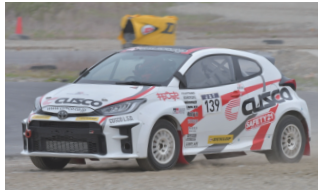
DUNLOP CUSCO GR ヤリス 目黒 亮