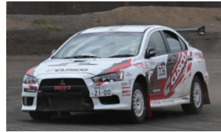
クスコ ADVAN WM ランサー 荒井信介