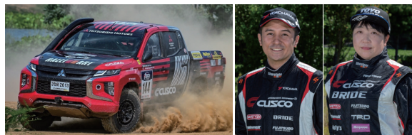
三菱トライトン (イメージ) 番場 彬 / 藤田 めぐみ