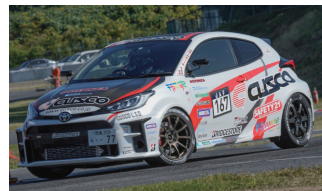
BS・クスコ GR ヤリス 菱井 将文