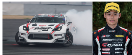
CUSCO GR86 星 涼樹