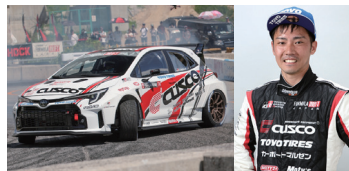
CUSCO GRカローラ 松山 北斗